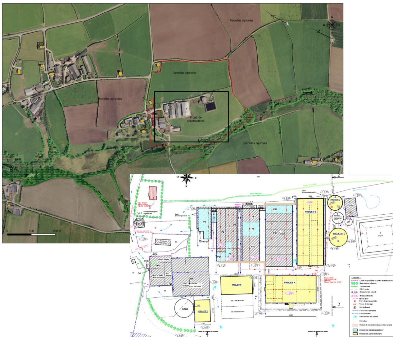
Vue aérienne du site de Kerascot et plan de l'extension envisagée (bâtiments en jaune).

L'extension permettra une augmentation de la production annuelle de 3 500 porcs charcutiers pour une production annuelle totale de 13 900 porcs charcutiers ainsi qu'une production laitière annuelle de 1 440 000 L 2 .